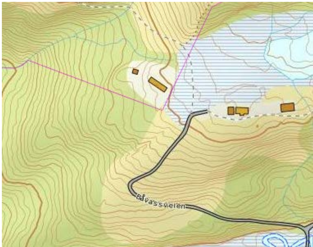
Parkeringsplassen og veien, som benyttes av sameierne, er på naboeiendommen.